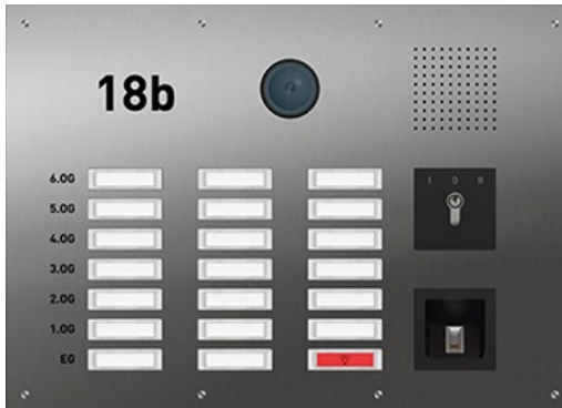
Produkt: TCS oder gleichwertig