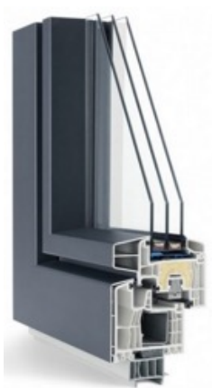
Fenster-, Türprofil, Symbolbild

Kunststoff, 3fach verglast, inkl. Griffe/Oliven