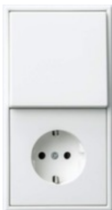
Produkt: Jung LS oder gleichwertig