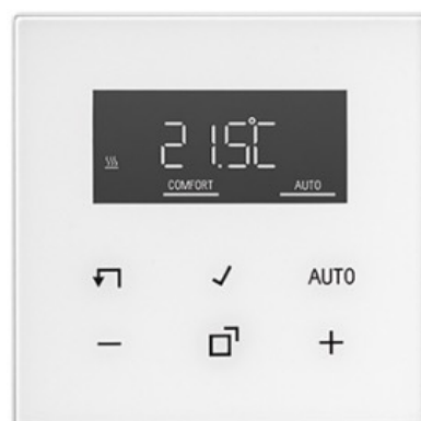
Produkt: Jung oder gleichwertig