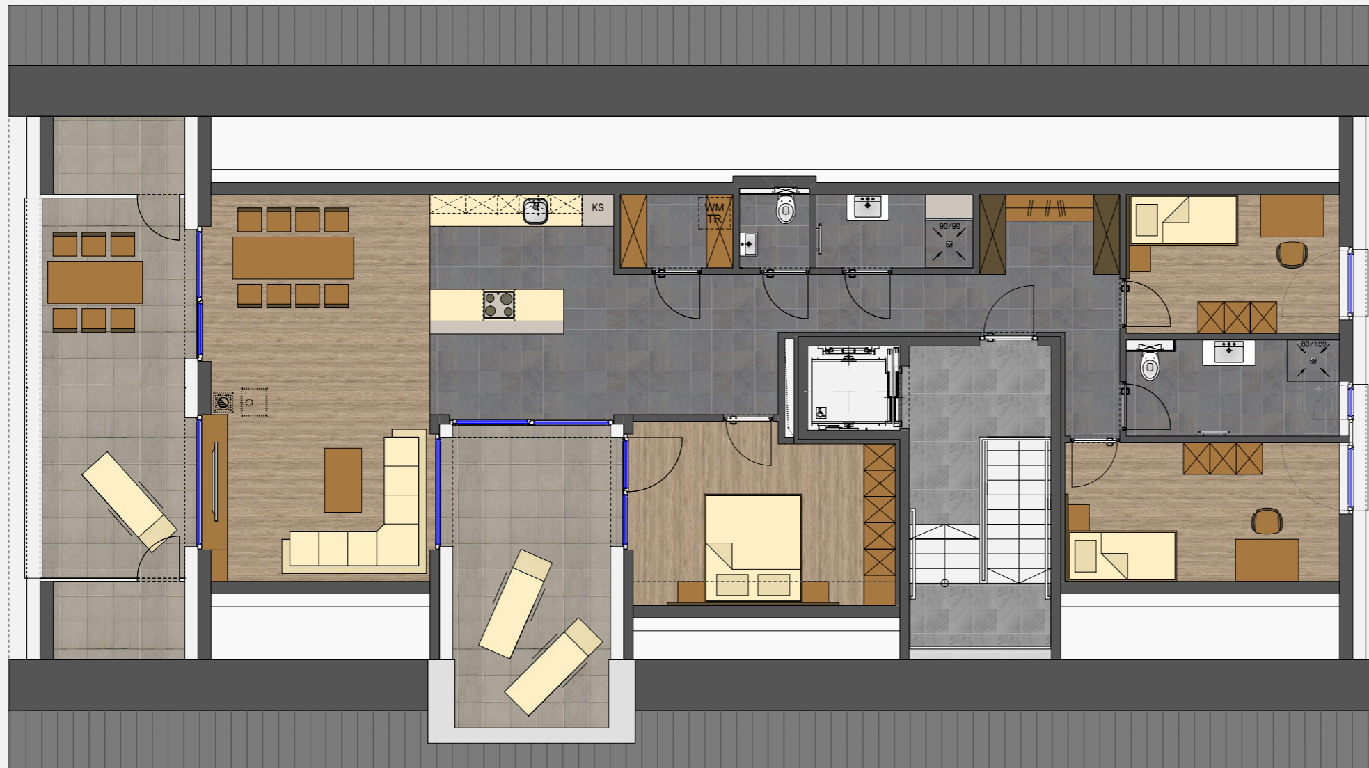
BEISPIEL M 1/100