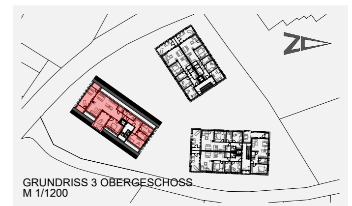
GRUNDRISS 3 OBERGESCHOSS M 1/1200