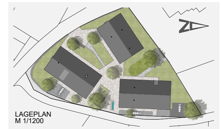
LAGEPLAN M 1/1200